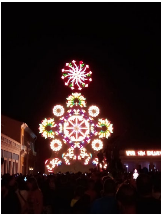
Ilustración 3. Trabajo de Plaza, San Salvador, 2022.