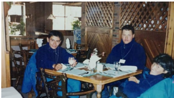
Figura II. Compañeros de la delegación argentina en las olimpiadas.