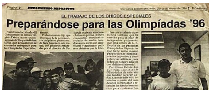
Figura I. Recorte del Diario el Cordillerano, 20 de marzo de 1996.

Fuente: Gentileza de Rodrigo Fernando Pérez (archivo personal).