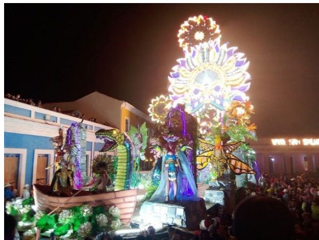
Ilustración 4. Carroza de Barrio San Salvador, 2022.

El trabajo de plaza de San Salvador trata sobre leyenda del Yacuruna , “el hombre de río”, en el idioma quechua, yaku significa agua y runa significa ser humano. Esta leyenda es originaria de Iquitos, en la región amazónica peruana. Este hombre vive en las profundidades del río Amazonas, viaja sobre un cocodrilo y usa como collares boas negras. Los pueblos originarios consideraban al ser humano como parte orgánica de la naturaleza, conciencia que los seres humanos contemporáneos hemos perdido. La seducción del Yacuruna , el retorno a la Pachamama, es una utopía que involucra dejarse seducir/encantar/sublimar por los poderes mágicos y desconocidos de la naturaleza. Este milenarismo cuestiona la versión, según la cual, en “el siglo XVIII, (...) se reportaba una extinción de comunidades indígenas en la Isla” (Castellón, Aróstegui y Medina, 2015, p. 275), que justifica el olvido generalizado de estas tradiciones.